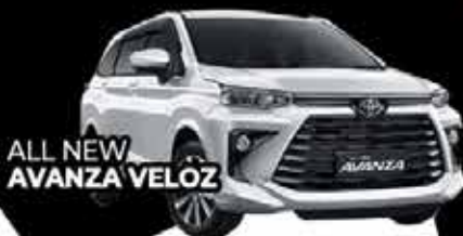
ALL NEW AVANZA VELOZ