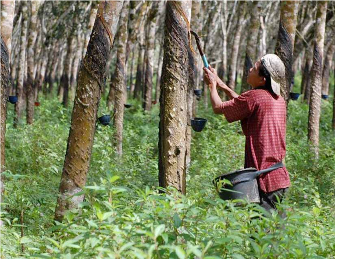
Ilustrasi perkebunan kelapa sawit. (Istimewa)