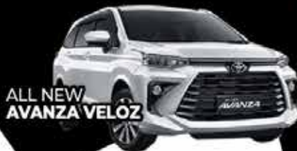
ALL NEW AVANZA VELOZ