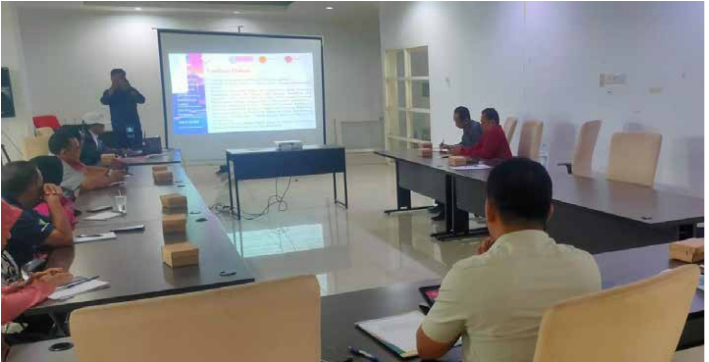
Persiapan lomba Desa Berprestasi di Kantor DPMD Kabupaten Paser