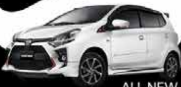
ALL NEW AGYA