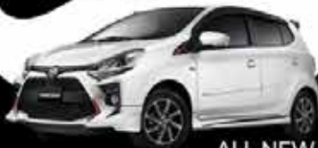
ALL NEW AGYA