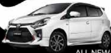
ALL NEW AGYA