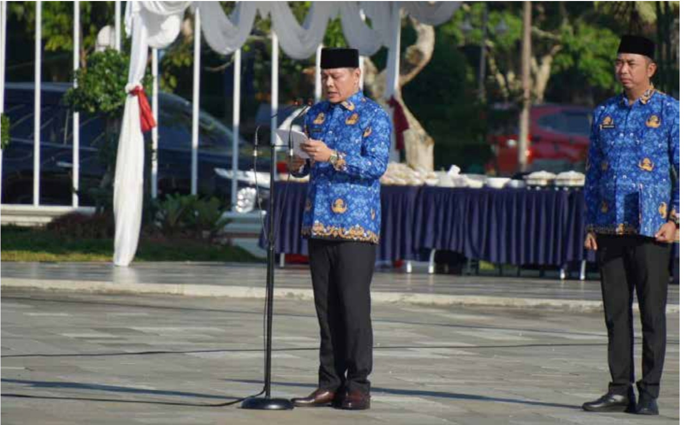
Bupati Paser, Fahmi Fadli pada apel gabungan Korpri.