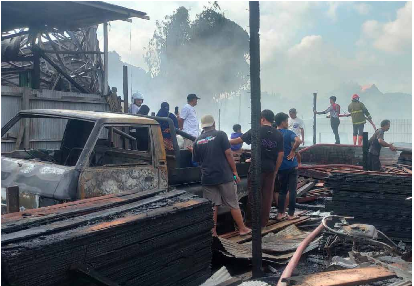
Kondisi bangunan yang habis terbakar.