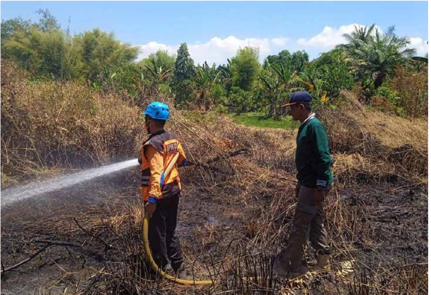
Petugas melakukan pemadaman api di lahan perumahan BTN PKT.