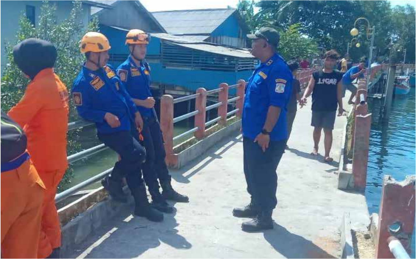
Tim SAR gabungan berada di lokasi kejadian di Sungai Pantai Manggar, Balikpapan Timur.