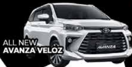
ALL NEW AVANZA VELOZ