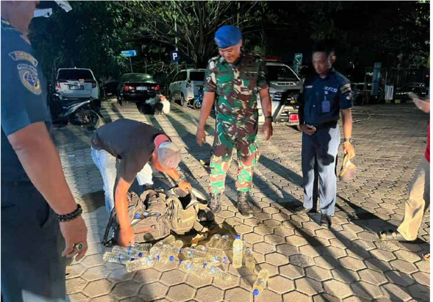
Pengamanan Tas Berisi miras di Pelabuhan Loktuan.