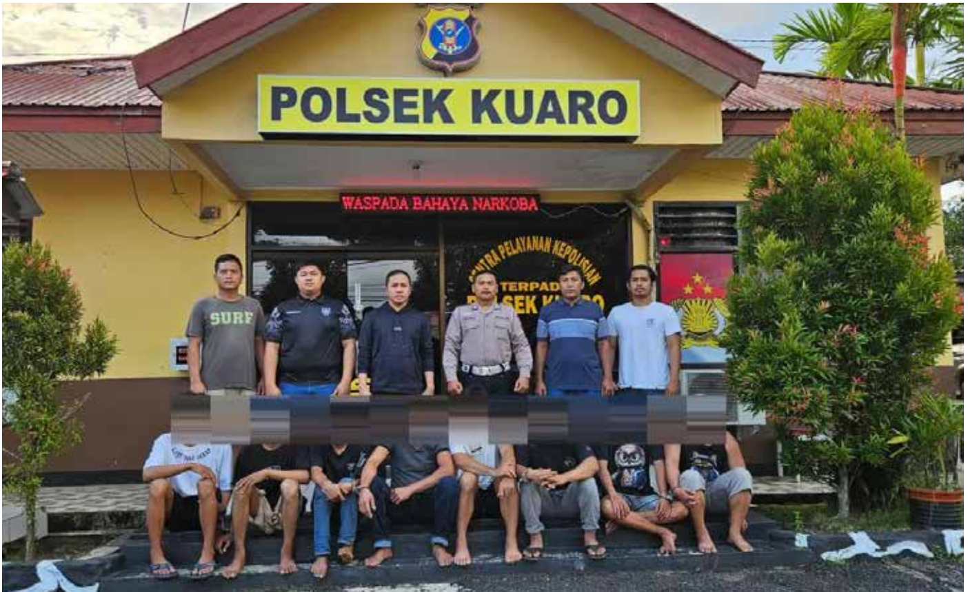
Para pelaku saat diamankan jajaran Polsek Kuaro