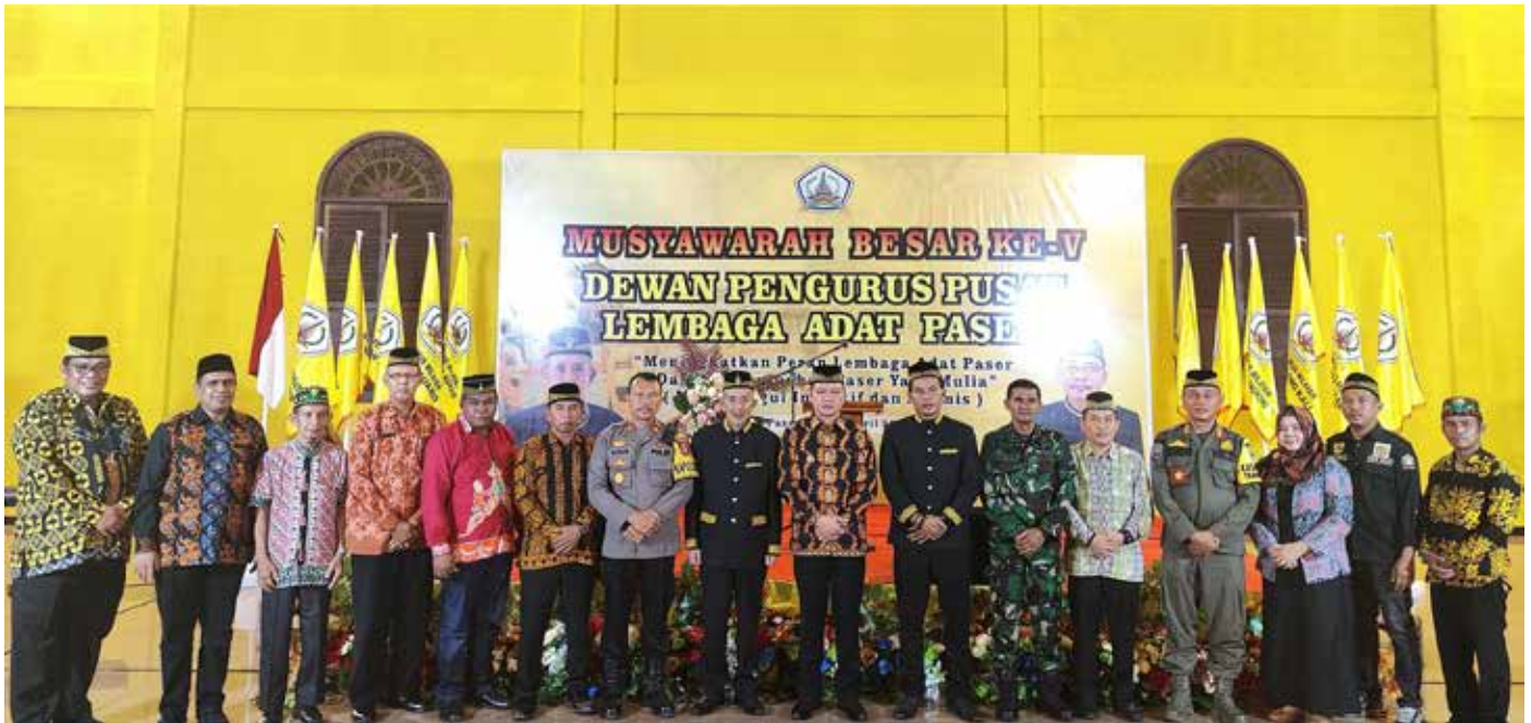
Ketua DPP LAP bersama Bupati Paser dan jajaran saat penutupan Mubes ke V