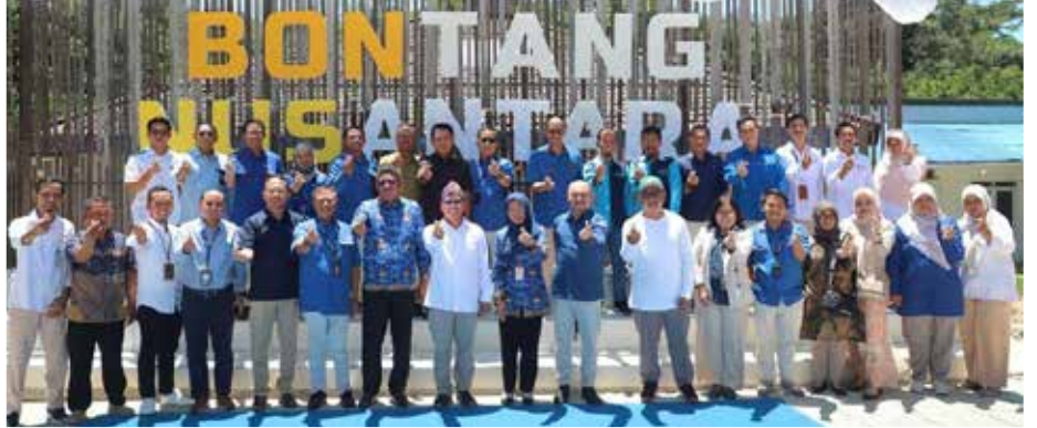
Peresmian nama Bontang Nusantara menggantikan nama Bontang Kuring Resto. (ist)

paikan Wali Kota kepada PT KMBU. Karena Bontang akan menyambut Ibu Kota Nusantara (IKN). Terlebih, mulai Juli 2024 ini akan mulai ditempati, sehingga Bontang Nusantara perlu disiapkan di Bontang sebagai kota penyangga IKN.