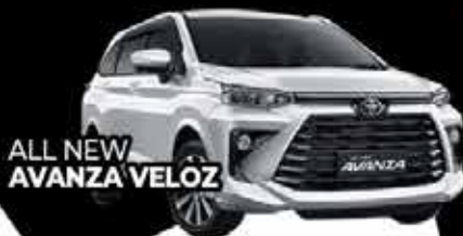
ALL NEW AVANZA VELOZ