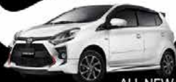
ALL NEW AGYA