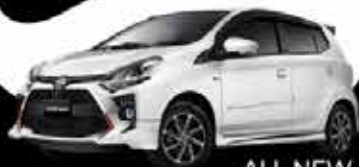
ALL NEW AGYA