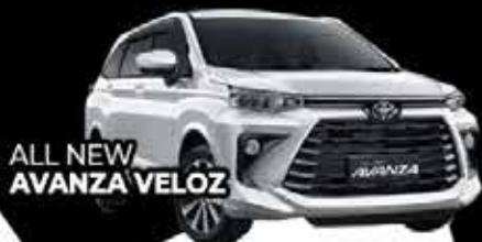
ALL NEW AVANZA VELOZ